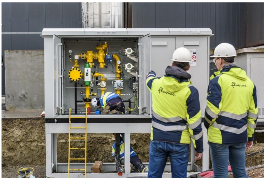
De installatie voor de injectie van biomethaan in Ieper

In de West-Vlaamse stad Ieper zijn de voorbereidingen voor de grootste biomethaaninjectie in Vlaanderen klaar. Het bedrijf BioBlue bouwt er een vergistingsinstallatie die organisch/biologisch afval zal omzetten in duurzaam biomethaan dat rechtstreeks kan worden geïnjecteerd in het gasdistributienet. Een piekcapaciteit van 2000 m 3 biomethaan per uur wordt voorzien.