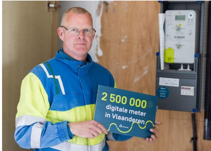
De 2,5 miljoenste digitale meter werd geïnstalleerd in Ravels (provincie Antwerpen)

Eind april 2023 plaatste Fluvius de 2,5 miljoenste digitale energiemeter in Vlaanderen. Deze belangrijke mijlpaal getuigt van de snelheid waarmee het uitrolprogramma vordert. In de eerste jaarhelft van 2023 werden 525.877 digitale meters geïnstalleerd, waar het vergelijkbare cijfer voor dezelfde periode in 2022 467.808 geplaatste meters bedroeg. Van alle digitale meters die tot nu toe geplaatst zijn, zijn er 1.571.788 (58,3%) elektriciteitsmeters en 1.123.980 (41,7%) gasmeters. Het totaal per eind juni 2023 vertegenwoordigt een jaar-op-jaar toename in de installatiesnelheid met +58.069 meters of +12,4%.