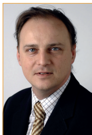
Jan De Nul