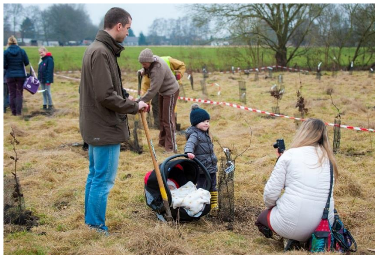
Bomen planten voor het ecobos in Duffel

In 2016 is Eandis gestart met haar ecobossen-project . Dit is gekoppeld aan de bedrijfsdoelstelling om de CO 2 -uitstoot per werknemer tegen 2020 met minstens 20% te verminderen. De concrete resultaten van de milieu-inspanningen van Eandis bepalen de omvang van de oppervlakte nieuw bos dat wordt aangelegd. Dit mechanisme spoort onze medewerkers aan in hun inspanningen voor duurzame mobiliteit en ondersteunt de lokale besturen in hun engagement om de eigen klimaatdoelstellingen te behalen. Op 19 februari 2017 heeft Eandis zo 1,3 ha nieuw bos met ongeveer 3.000 inheemse bomen aangeplant in de gemeente Duffel.